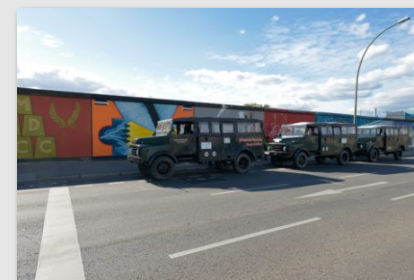
East Side Gallery