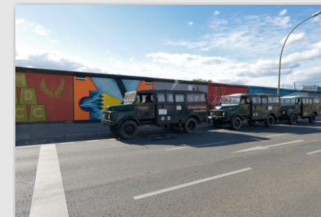
East Side Gallery